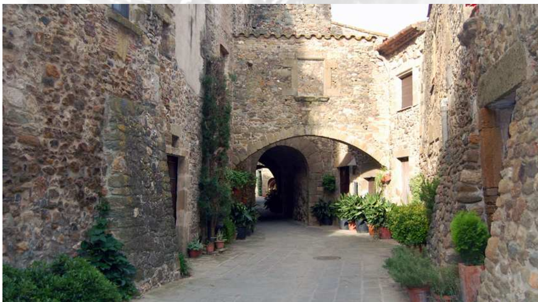
Les Gavarres, Peratallada.

RETECORK RED EUROPEA DE TERRITORIOS CORCHEROS