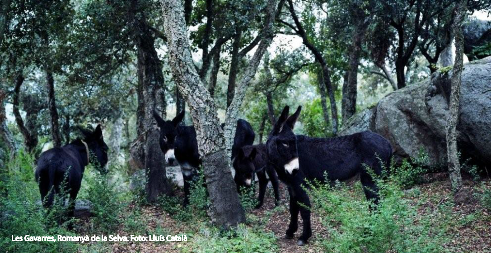
Les Gavarres, Romanyà de la Selva.