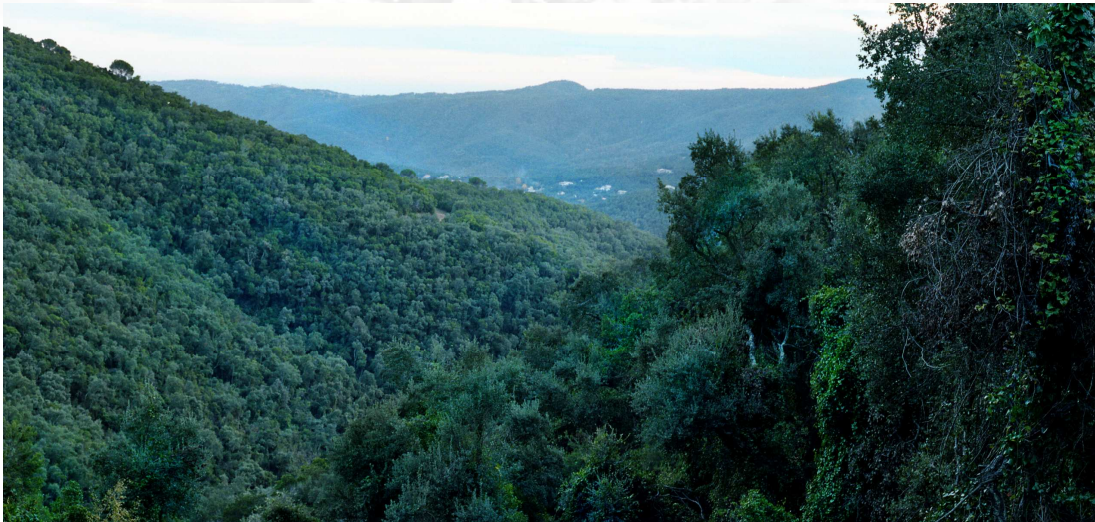
Les Gavarres, Romanyà de la Selva.

En el Macizo de Les Gavarres se localizan los alcornocales y bosques de pino marítimo más importantes del territorio catalán. El paisaje predominante está configurado por matorrales de brezo y jara, con un estrato arbóreo de alcornoques, pinos y abundancia de madroño. Destacar la vegetación de torrentes y umbrías húmedas, más propia de ambientes eurosiberianos, como los bosques de alisos, avellanos y castaños, que contrastan con el resto del territorio predominantemente mediterráneo.