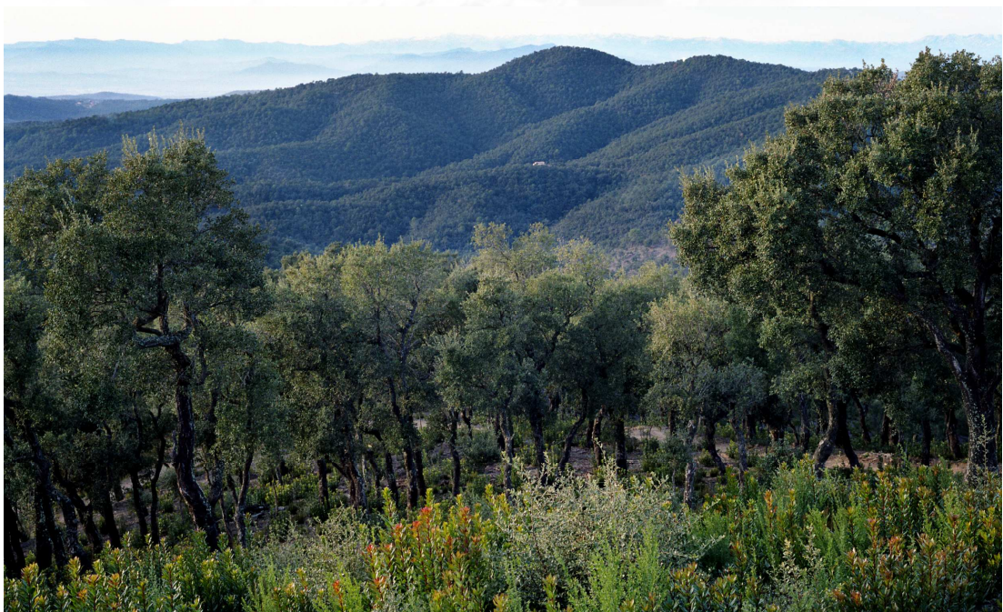
Les Gavarres, Romanyà de la Selva.

Se trata de un espacio incluido en el Plan de Espacios de Interés Natural de Cataluña e incluido en la Red Natura 2000.