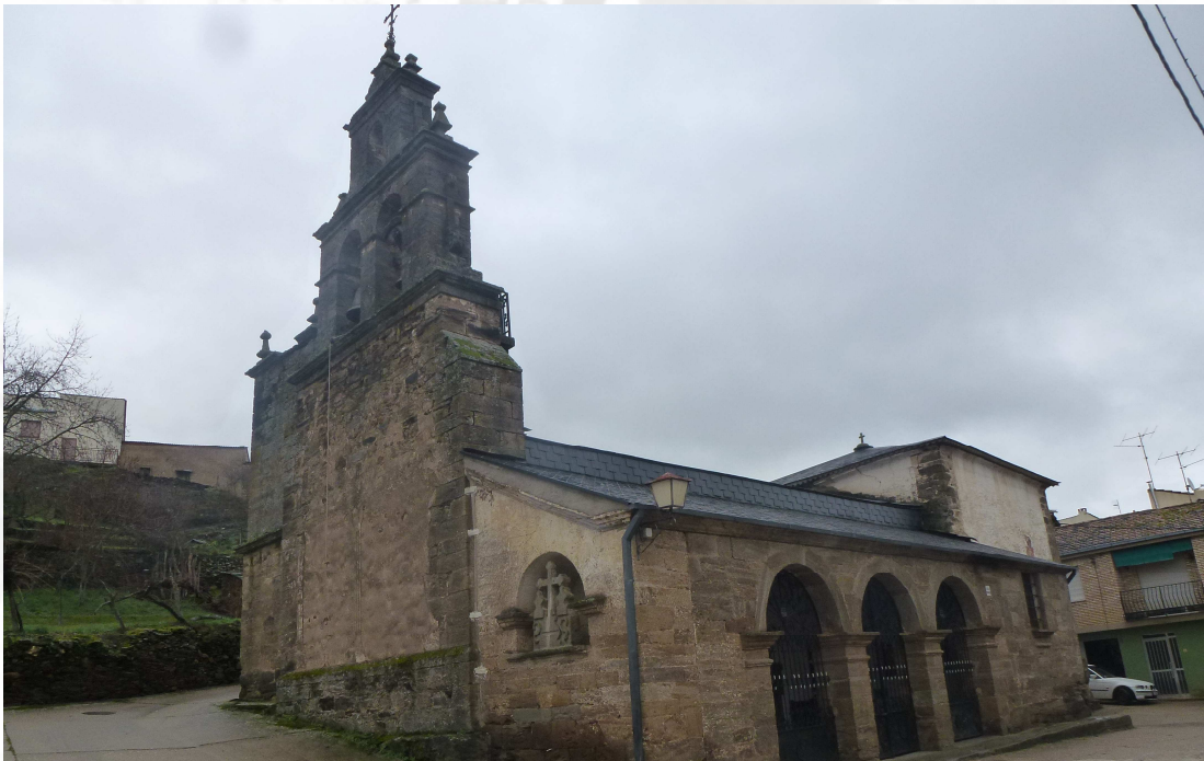
Iglesia del entorno.

Otros monumentos destacados de la zona son las iglesias, entre las que encontramos las de los núcleos de Alcañices, Ferreras de Arriba, Moveros, Riego del Camino, Santa Eulalia de Tábara, Otero de Bodas y Rionegro del Puente.