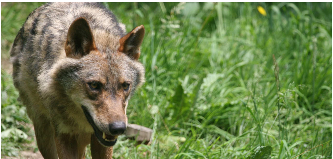
Lobo ibérico.

Por lo que se refiere a los mamíferos, son 29 las especies que se han contabilizado, sobresaliendo la importante población de lobo ibérico, el corzo, el gato montés y la nutria.