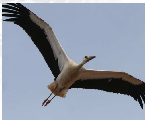
Cigüeña blanca.