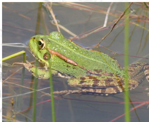
Rana común.