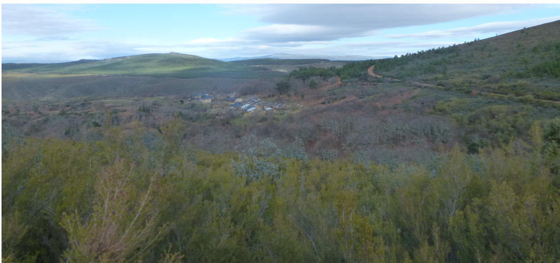
Sierra de la Culebra.

La Sierra de la Culebra es un Espacio Natural Protegido. Desde 1973 es una Reserva Nacional de Caza, y desde 1992 está incluido en el Plan de Ordenación de los Recursos Naturales. Cuenta con una superficie aproximada de 65.891 ha.